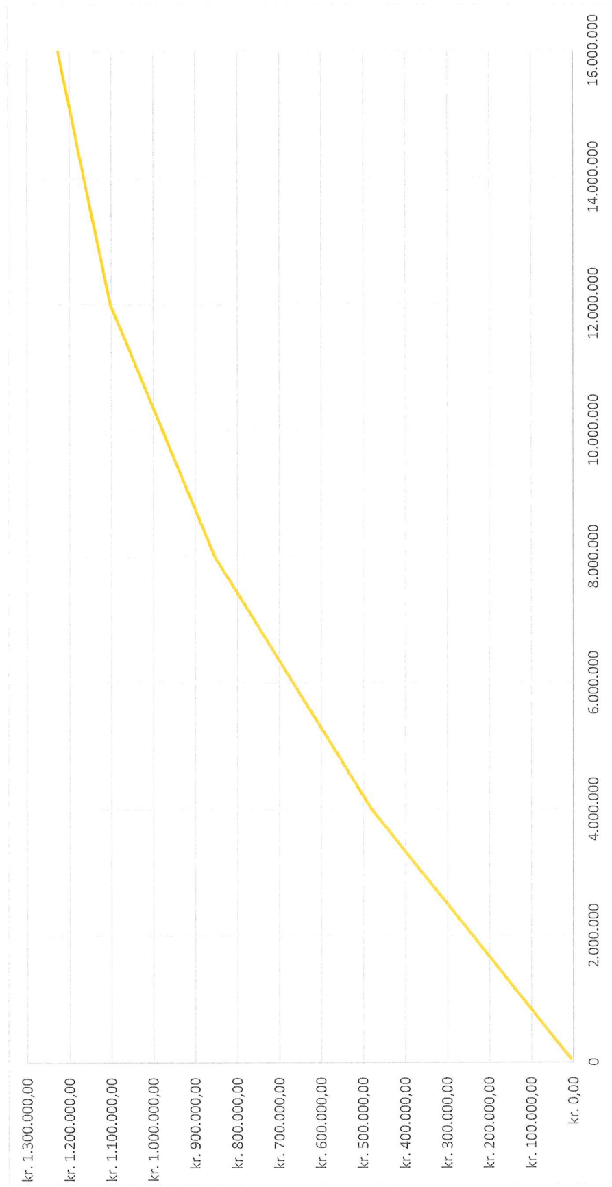
Bilag 2 til Aftale mellem ABM-institutionerne og Copydan BilledKunst om priser og vilkår for tilgængeliggørelse på internettet af fotografier i institutionernes samlinger